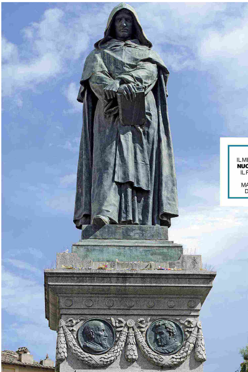
La statua che ricorda l'esecuzione sul rogo di Giordano Bruno (1548-1600) in Campo de' Fiori a Roma

colpevolezza. Il papa Clemente VIII Aldobrandini non sapeva cosa fare. Anzi, si oppose a che lo si torturasse. A questo punto è Bruno a rompere. Il Papa vorrebbe salvarlo, ma per questo era necessaria una sua abiura. Lui rispose che non aveva niente di cui pentirsi. Sostenne che tramite il fumo del rogo sarebbe asceso in paradiso. Una persecuzione che lo accomuna a un altro filosofo successivo, Spinoza, scacciato dalla comunità ebraica di